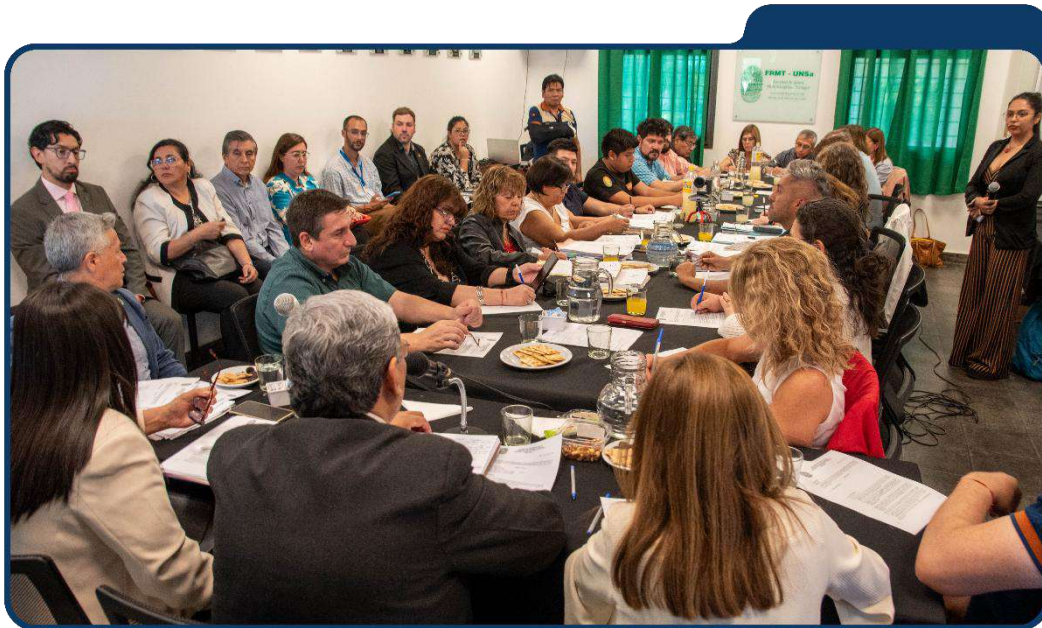
Foto 3: Sesión del Consejo Superior en la Facultad Multidisciplinar de Tartagal

Desde el Consejo Superior, se adaptó el funcionamiento del cuerpo, a la nueva conformación del mismo, motivada por la incorporación de nuevos consejeros: Decana/o, Profesor/a y Estudiantes de las Facultades Regional Multidisciplinar Tartagal y Regional Orán, lo que llevó a que hoy sesione con treinta miembros . En una política federal, se dispuso que el Consejo Superior sesione en el mes de octubre en la Facultad Regional Multidisciplinar de Tartagal, esperando en los próximos años hacerlo propio en Orán, Metán, Rosario de la Frontera, Cafayate y se avanzó en la participación virtual de los consejeros del interior provincial .