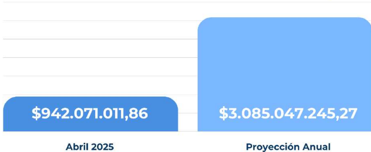
Figura 2. Evolución del déficit en el Inciso 1 – Personal.

Del análisis de la información relevada surge que al mes de abril de 2025 el déficit acumulado ascendía a $942 millones. Proyectado al conjunto del ejercicio presupuestario, el déficit heredado alcanzaba los $3.085 millones.