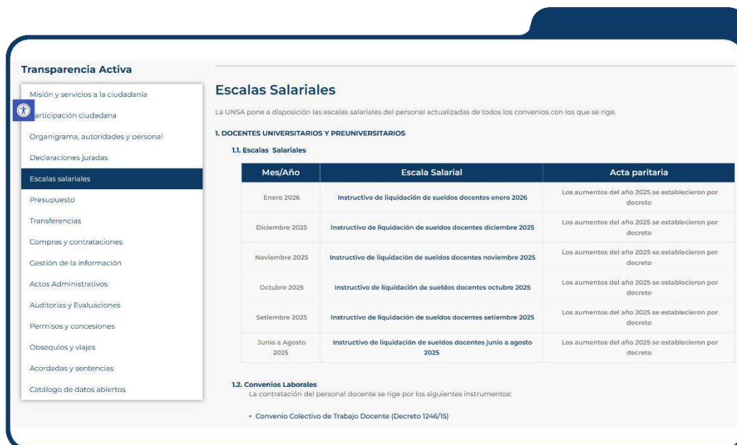
Foto 5: Captura de pantalla de la interfaz del Portal de Transparencia