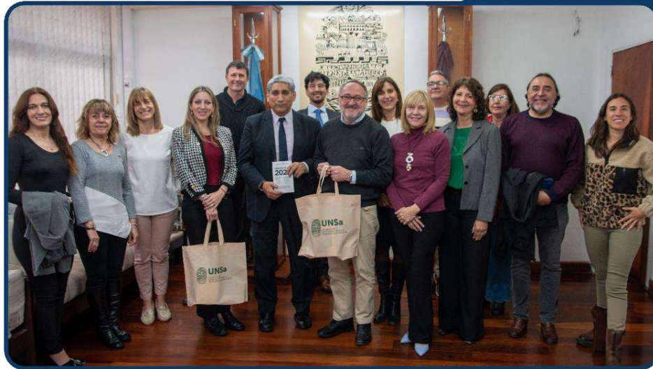
Foto 16: Reunión entre las autoridades de la UNSa con el Dir. de R.R.I.I. de la UNIR de España, y la representante de la casa de estudios en Argentina

Estas funciones se desarrollaron en coordinación con las áreas involucradas en cada acuerdo, garantizando la validación institucional y la tramitación administrativa correspondiente.