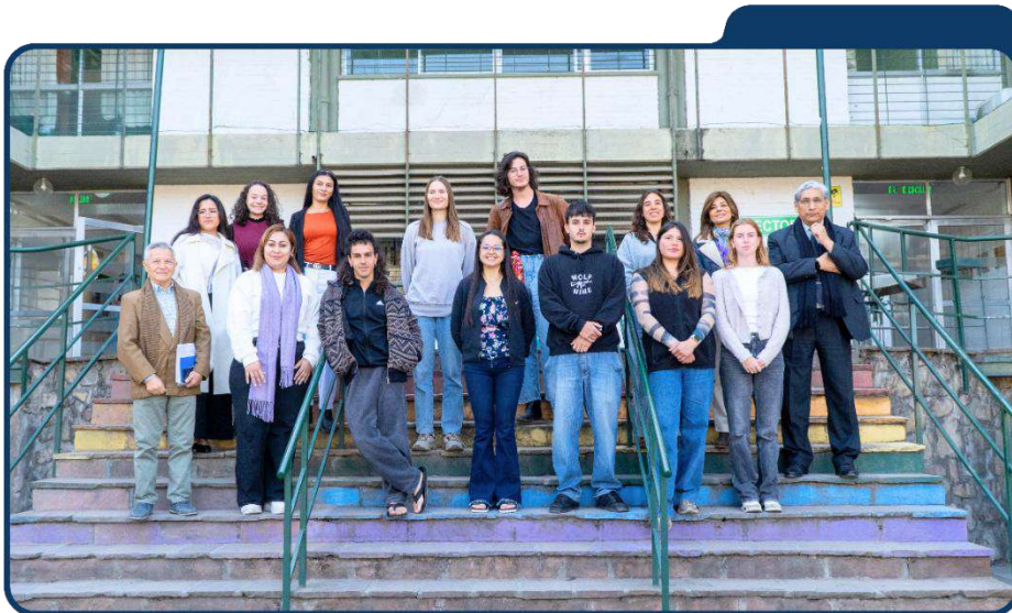
Foto 17: Estudiantes del programa de movilidad académica en las escaleras del rectorado de la UNSa

En el segundo cuatrimestre 2025, la UNSa recibió a 16 estudiantes provenientes de España, Suecia, Brasil, Perú, Colombia, Nicaragua, Honduras, El Salvador y Costa Rica . En el ámbito de movilidad estudiantil, dos estudiantes de la UNSa realizaron movilidad hacia universidades del exterior . De igual manera, la planificación para 2026 prevé la recepción de 16 estudiantes entrantes para el primer cuatrimestre y 6 salientes, consolidando un esquema de intercambio creciente y sostenido.